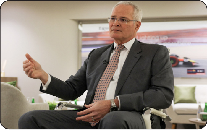
برميل يومياً بحلول عام 2029. ويقع حقل مجنون النفطي على بعد 60 كيلومتراً من البصرة في

الحكومة العراقية، للتأكد من أنه اتفاق يعود بالنفع على الجانبين، مضيفاً أن العملية لا تزال في مراحلها الأولى. وأضاف أن النفط والغاز سيلعبان دوراً حاسماً لفترة طويلة قادمة، وأثار تساؤلاً حول مدى استمرار استخدامهما كوقود. ووفق وودز، ففي حين أن التطورات التكنولوجية ربما تحدث تغييراً في استخدام الهيدروكربونات في المستقبل، لكن سيتواصل استخدامها لأغراض