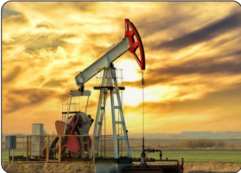
وقر تحالف أوبك+، الذي يضم منظمة البلدان المصدرة للبترول (أوبك) وحلفاءها، يوم الأحد زيادة الإنتاج بشكل طفيف في

ارتفعت أسعار النفط في آخر جلسة وسط آمال بأن تتمكن المجر من استخدام النفط الروسي مع لقاء الرئيس الأمريكي دونالد ترامب برئيس الوزراء المجري فيكتور أوربان في البيت الأبيض، إلا أن الأسعار سجلت خسارة للأسبوع الثاني على التوالي. وصعدت العقود الآجلة لخام برنت 25 سنتاً، أو 0.39%، إلى 63.63 دولار للبرميل عند التسوية. وبلغ سعر خام غرب تكساس الوسيط الأمريكي 59.75 دولار للبرميل مرتفعاً 32 سنتاً، أو 0.54%. وسجل الخامان خسارة بنحو 2% هذا الأسبوع، مع زيادة منتجين عالميين رئيسيين الإنتاج. وقال جون كيلدوف، الشريك في "أجين كابيتال": "نتابع اجتماع ترامب مع