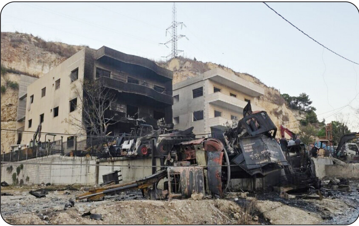
الغارات الأربع أكثر من 360 وحفارات، إضافة إلى مصنع وآلية ثقيلة، بينها جرافات للإسمنت والأسفلت. وقال وبحسب المنظمة، دمرت