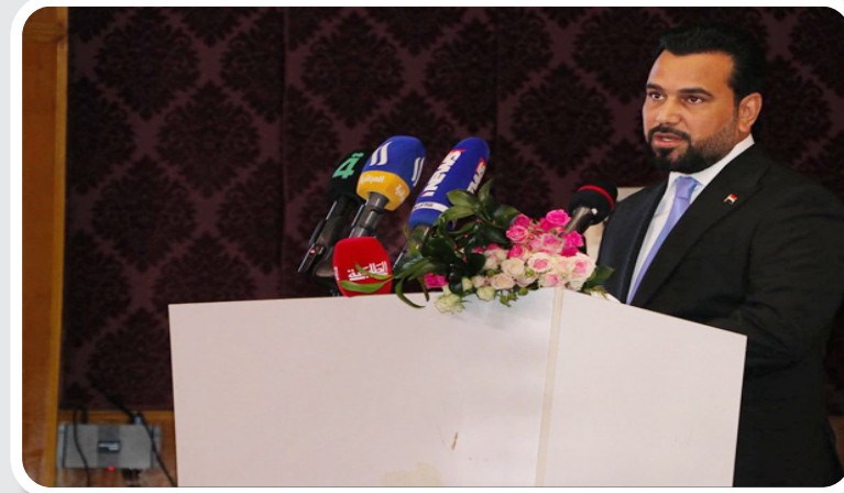
بغداد / صوت القلم: <

في تحسين الخطاب الإعلامي والاتصالي". وأضاف "أن الدور الذي يضطلع به قسم العلاقات العامة في هذا السياق يعزز من مكانة الكلية بوصفها مؤسسة أكاديمية فاعلة، تساهم في ترسيخ ثقافة التقويم الموضوعي، وتمنح المؤسسات فرصة حقيقية للاطلاع على صورة أائها لدى الجمهور بعيداً عن المجاملات".