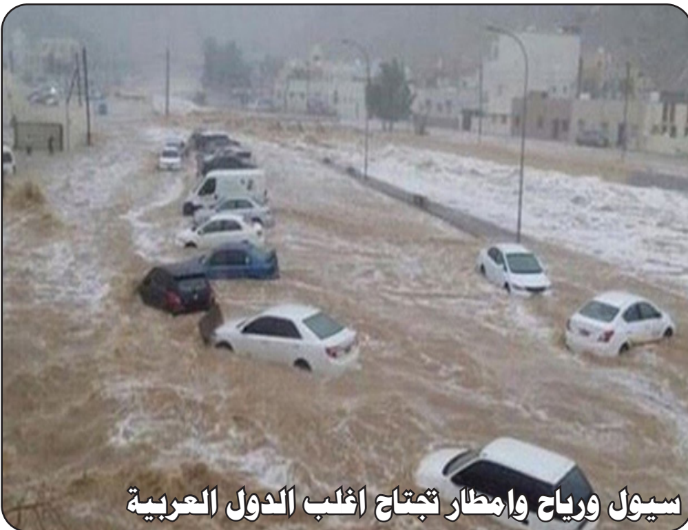
سيول ورياح وامطار تجتاح اغلب الدول العربية