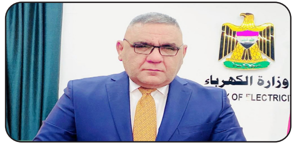
بغداد / متابعة صوت القلم: