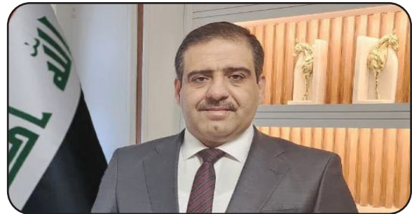
بغداد / متابعة صوت القلم:

أوضح وزير التجارة أثر تطبيق تجارة التجار الإلكترونية، فيما أشار إلى أن التطبيق سيمتد غش المواطنين الراغبين بالشراء عبر مواقع التواصل. وقال الغريري في تصريح للوكالة الرسمية: إن تطبيق التاجر الإلكتروني هو خدمة لتطبيق التجارة الإلكترونية من خلال اصدار رخصة التاجر إلكترونياً وتسجيل الشركة الكترونياً.