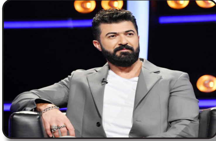
المقرر طرحه خلال الفترة القريبة من الحفلات ضمن نشاطه الفني المقبلة، كما يستعد لإحياء مجموعة لاصيف 2026.

يستعد النجم العراقي سيف نبيل لمرحلة فنية جديدة، كاشفاً عن ذلك من خلال منشور عبر حسابه الرسمي على إنستغرام، حيث نشر صوراً له من داخل صالة الرياضة وأرفقها بالقول "حالياً أحضر لمرحلة جديدة... كل شي فيها جديد". وظهر سيف نبيل بإطلالة رياضية، في إشارة واضحة إلى التحضيرات التي يقوم بها على مختلف المستويات، ما يعزز من حالة الترقب لدى جمهوره لما يحمله هذا التحول من أعمال وخطوات فنية خلال الفترة المقبلة. وكان سيف نبيل قد انتهى مؤخراً من تصوير عمل فني جديد، من