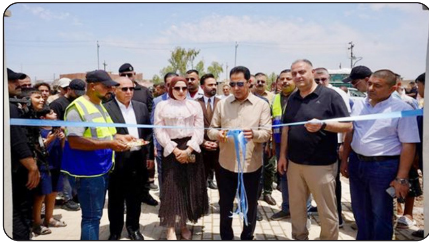
بغداد / متابعة صوت القلم: افتتح محافظ نينوى عبد القادر الدخيل متنزه تل الرمان في الجانب الأيمن من مدينة الموصل بعد استكمال جميع الأعمال التنفيذية وأعمال التشجير والزراعة بحضور عدد من المسؤولين المحليين ومدراء الدوائر الخدمية. وقال الدخيل في تصريح للوكالة الوطنية العراقية للانباء /نينوا/: "إن متنزه تل الرمان يعد من المتنزهات النموذجية الجديدة في الجانب الأيمن وقد انجز وفق مواصفات حديثة ليكون متنفساً

تنفيذ خطتها لزيادة المساحات الخضراء وتحسين الواقع البيئي والجمالي للمدينة" مشيراً إلى افتتاح عشرات الحدائق والمتنزهات خلال الفترة الماضية بالتزامن مع العطلة الصيفية وارتفاع أعداد الزائرين للمرافق الترفيهية في الموصل". وأكد الدخيل أن هذه المشاريع تسهم في توفير بيئة مناسبة للعائلات والشباب، فضلاً عن تحسين المشهد الحضري للمدينة "لافتاً إلى أن العمل مستمر لإنشاء وتأهيل المزيد من المتنزهات والحدائق في مختلف أحياء الموصل ضمن برامج الاعمار والتطوير التي تشهدها المحافظة".