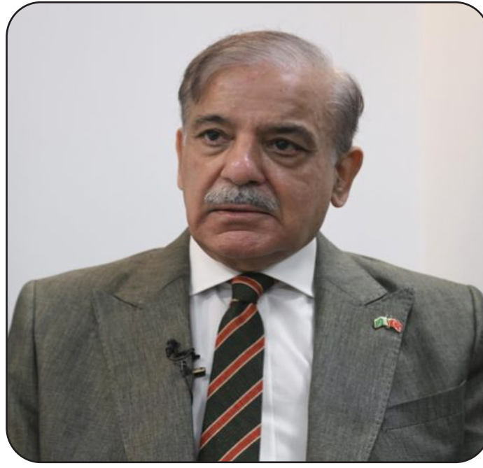
مذكرة التفاهم لن يكون اليوم الأحد

وقال رئيس الوزراء الباكستاني شهباز شريف، إن الولايات المتحدة وإيران اتفقتا على إطار اتفاق سلام ينهي الحرب المستمرة منذ شهور في الشرق الأوسط، وذلك بعد التوصل إلى نص نهائي للاتفاق. وقال شريف في منشور على منصة "إكس": "نحن أقرب إلى اتفاق سلام من أي وقت مضى. ومع توقع إتمام الاتفاق خلال الساعات الـ 24 المقبلة". وذكر شريف أن باكستان تستعد الآن للتوقيع إلكترونياً على الاتفاق والمتوقع في غضون الساعات الأربع والعشرين المقبلة، ويعقب ذلك محادثات على المستوى الفني خلال الأسبوع.